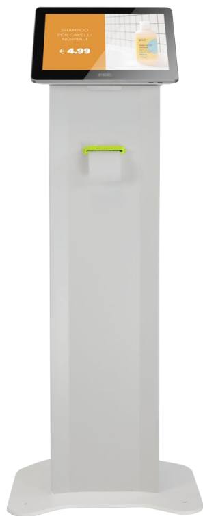
Con Panel PC PP 9635 CL 15"