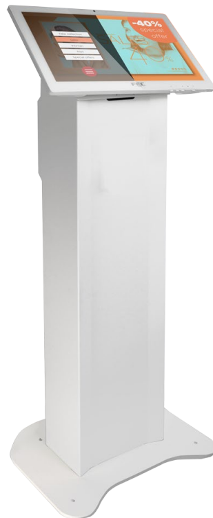
Con Panel PC Witouch 5 19,5"