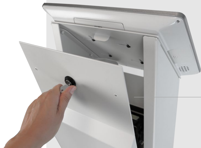
Sportello posteriore con serratura per effettuare interventi di manutenzione e per sostituire il rotolo carta della stampante