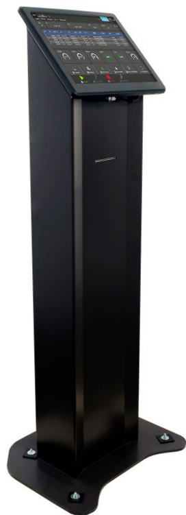
Con Panel PC PP 9635 A 15"