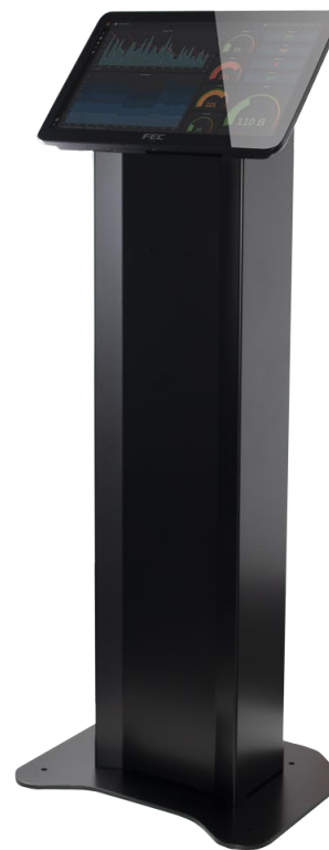
Con Panel PC MRT 190 19,5"