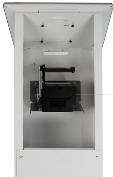
Stampante a pannello Integrata - Anche fiscale-