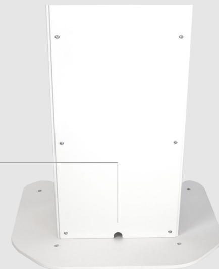
Foro passacavi inferiore