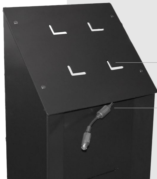
Attacchi VESA per installare il Panel PC