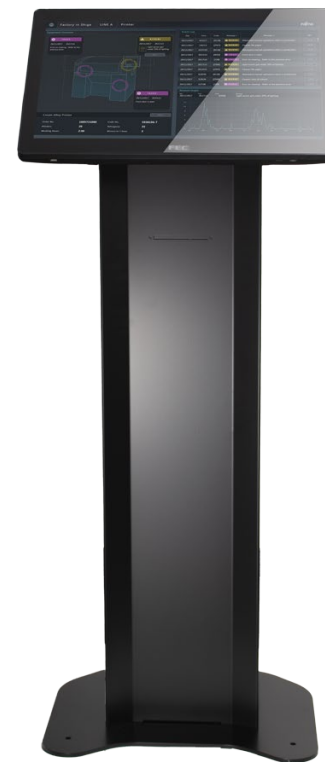
Con Panel PC PP 8632 22"